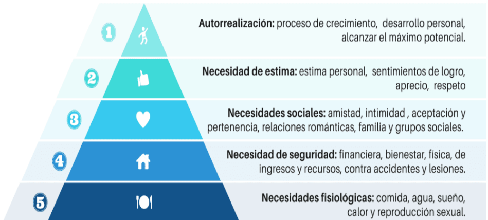
Figura 4. Pirámide de las Necesidades

objetivos de manera autónoma si se encuentran en un ambiente propicio.